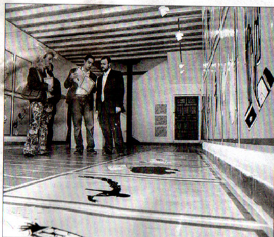
La exposición '¿Quién repite la historia?' se inauguró ayer.

La exposición 'Qui répète l'histoire?' se inauguró ayer mismo en